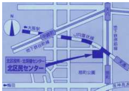
北区民センター(扇町・天満)