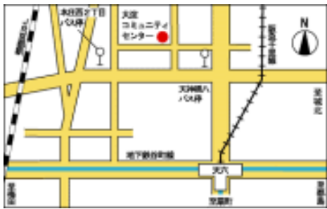
大淀コミュニティセンター(天六)

地下鉄堺筋線・谷町線「天神橋筋六丁目」駅 徒歩 8分 地下鉄堺筋線「扇町」駅 徒歩 3分、JR「天満」駅 徒歩 3分 JR 環状線「芦原橋」徒歩 5分、南海汐見橋線「芦原町」徒歩 3分